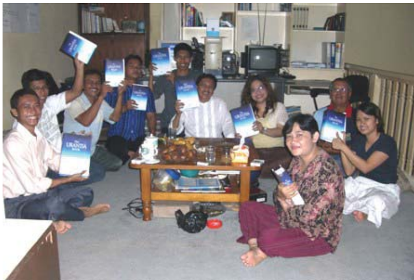
El grupo de estudio Prana Cipta Urantia Indonesia muestra nuevos libros de Urantia

hemos tenido problemas de religión pues estudiamos problemas morales y espirituales. En nuestro grupo de estudio, una de las instrucciones referentes al procedimiento es abrir nuestro "ojo espiritual" para reconocer y ver al "Mensajero de Dios" que existe en el mismo ser humano (en El Libro de Urantia se refieren a él como el Ajustador). Después de aprender a reconocer al "Mensajero de Dios" (el Ajustador), les introducimos en El Libro de Urantia , y se sigue con el estudio de El Libro de Urantia en el Grupo de Estudio II (Prana Cipta Urantia Indonesia).