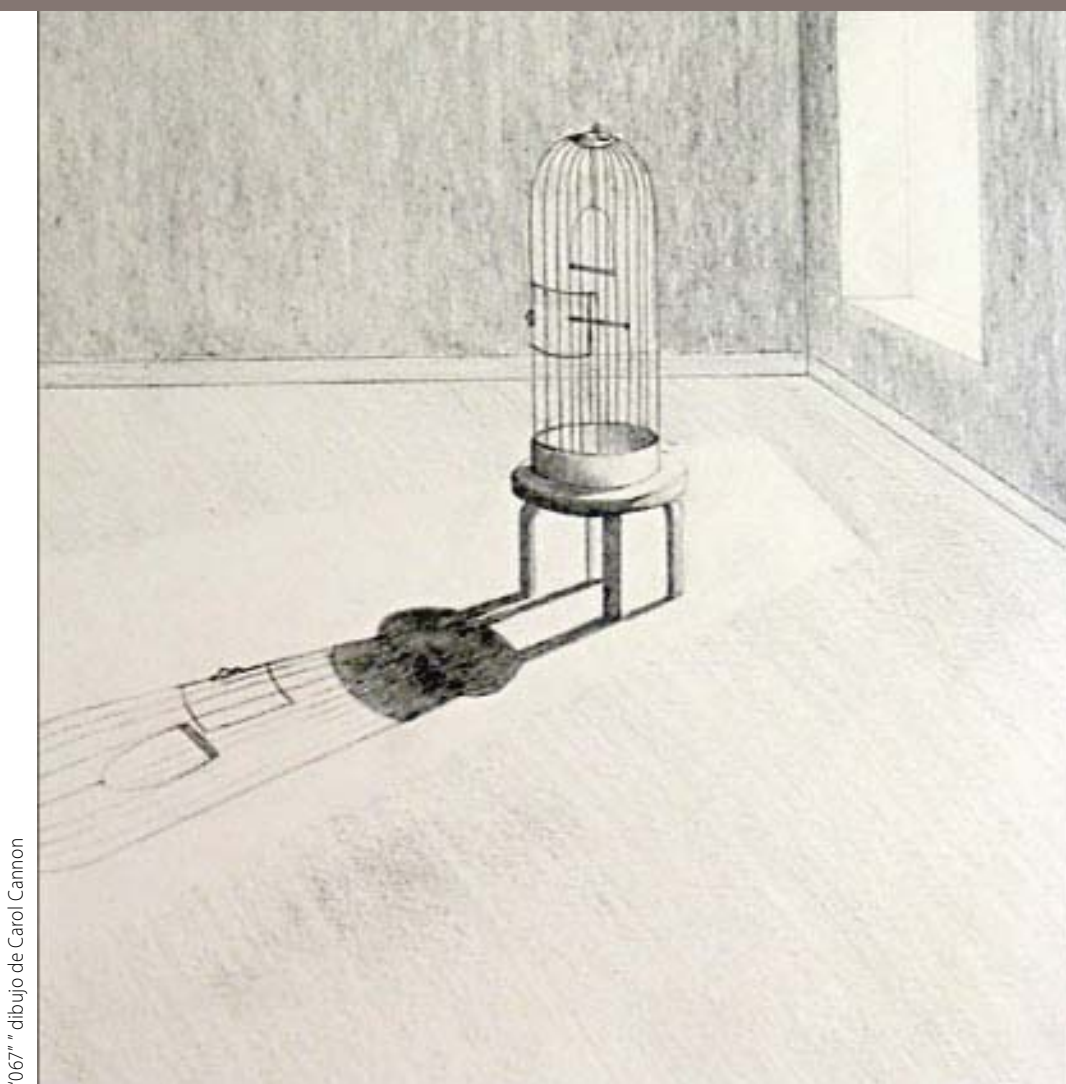
"067" " dibujo de Carol Cannon