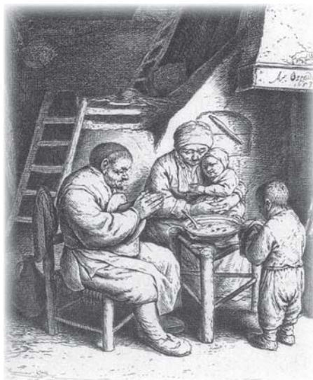
"Oración antes de la comida" Adriaen Jansz. van Ostade, aguafuerte, 1653