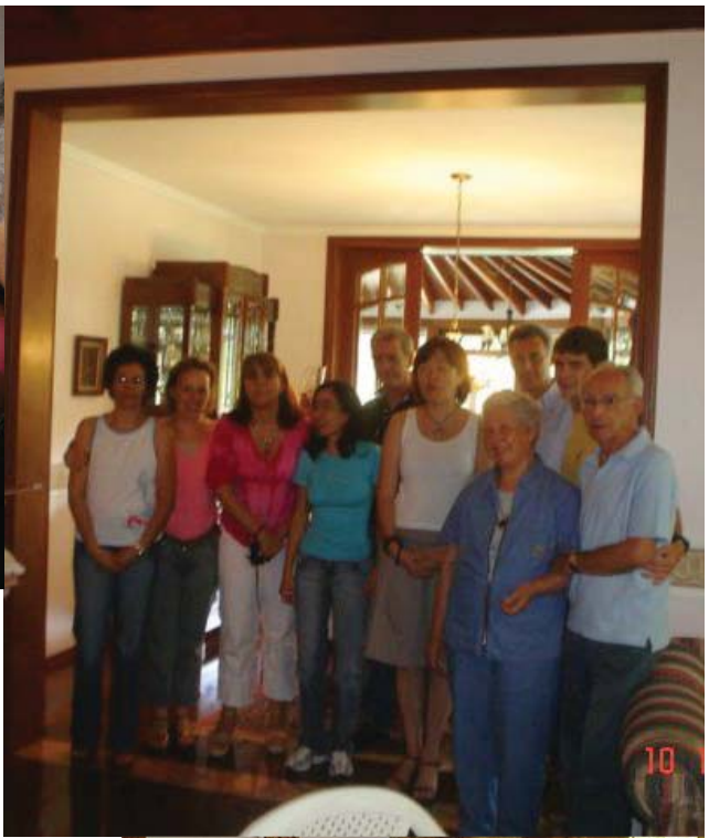
BRASIL 2 foto de grupo