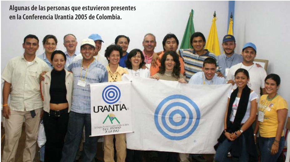
Algunas de las personas que estuvieron presentes en la Conferencia Urantia 2005 de Colombia.