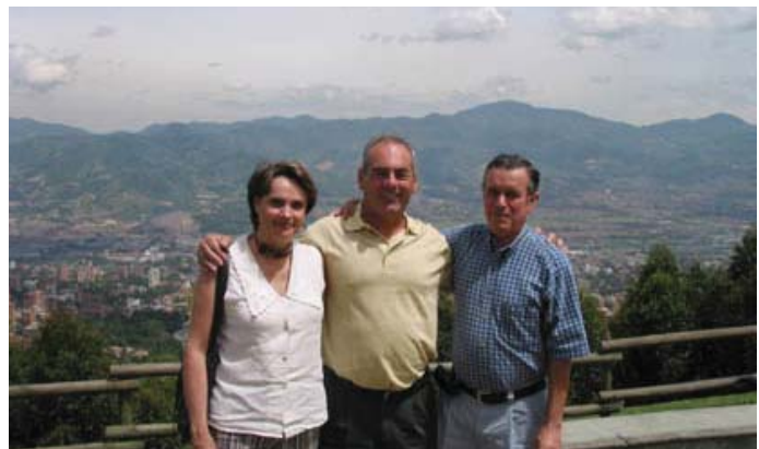
Amigos en Medellín

toda belleza y exalta toda bondad. Por medio de símbolos inteligentes, el hombre es capaz de vivificar y ampliar la capacidad de apreciación de sus amigos. Este poder y esta posibilidad de estimulación mutua de la imaginación es una de las glorias supremas de la amistad humana. Existe un gran poder espiritual inherente en la conciencia de estar consagrado de todo corazón a una causa común, de ser mutuamente fieles a una Deidad cósmica. LU □