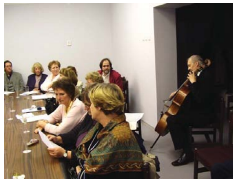
Cellist Peeter Paemurru interpreta a Bach.