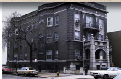
Fundación Urantia, 533 Diversey, Chicago