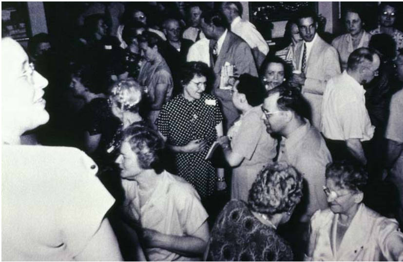
Fiesta del Forum, años 30