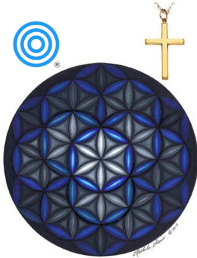
Symboles conceptuels inspirés par la religion de Jésus

La religion est exclusivement une expérience spirituelle personnelle — connaître Dieu comme un Père — mais le corollaire de cette expérience — connaître l'homme comme son frère — entraîne l'ajustement du « moi » à d'autres « moi », ce qui implique l'aspect social ou collectif de la vie religieuse. La religion est d'abord un ajustement intérieur ou personnel ; elle devient ensuite une affaire de service social ou d'ajustement à un groupe. La formation de groupes religieux découle forcément du caractère grégaire des hommes, et le sort de ces groupes religieux dépend beaucoup de l'intelligence de leurs chefs. Dans la société primitive, le groupe religieux n'est pas toujours très différent des groupes économiques et politiques. La religion a toujours été conservatrice de morale et stabilisatrice de société. Cela reste vrai, bien que de nombreux socialistes