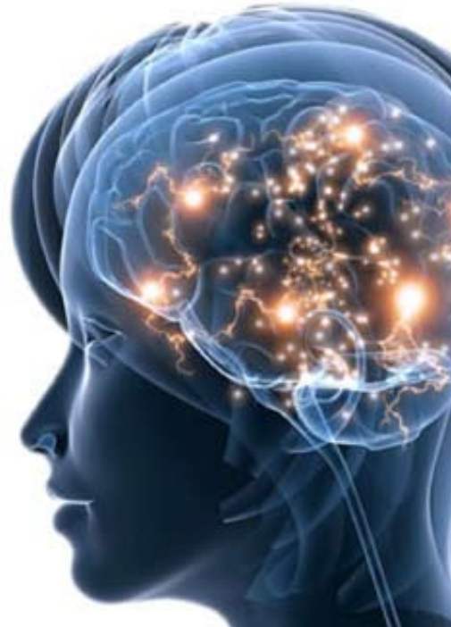
Stimuler la réflexion illustration

7. L'esprit de sagesse — la tendance naturelle chez toutes les créatures morales à progresser au sein d'une évolution ordonnée. Cet adjuvat est le plus élevé des sept ; c'est celui qui coordonne l'esprit et articule le travail de tous les autres. Cet esprit est le secret de l'impulsion innée des créatures mentales à entamer et à soutenir le programme effectif et pratique de l'échelle ascendante de l'existence ; ce don des choses vivantes qui explique l'incompréhensible aptitude des créatures vivantes à survivre, et à utiliser dans leur survie la coordination de toute leur expérience passée et de toutes les occasions présentes pour acquérir la totalité de ce que les six autres ministres mentaux peuvent mobiliser dans le mental de l'organisme intéressé. La sagesse est l'apogée des performances intellectuelles. La sagesse est le but d'une existence purement mentale et morale. [Fascicule 36:5.6 à 5.12 ; page 402. 3 à .9]