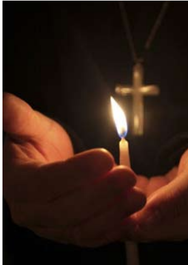
La lumière de la vérité—répandant la chaude lueur de l'amitié entre croyants photo

L'esprit peut en appeler certains au service dans un flot direct à l'intérieur du lit de la rivière du christianisme, d'autres pourront aller en des terres étrangères, d'autres consolider leur foyer de base et d'autres encore s'assembleront sous la bannière de Micaël, souverain de Nébadon ; ce sont tous les enfants du même Père Universel de toutes les personnalités. Tous sont unis par la fraternité.