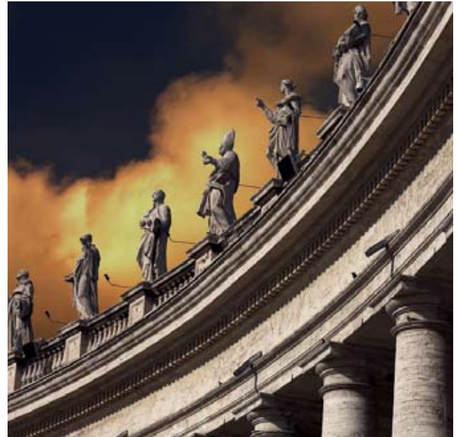
Photographie : Sagesse des âges

Dans sa jeunesse, Jésus a étudié les écritures de son lieu et de son temps. En tant que jeune adulte, à l'âge de 27 ans,