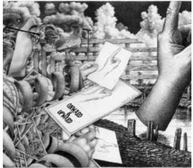
En avant et vers le haut illustration

Si nous voulons réellement rechercher la sagesse divine sur cette question, il nous faut accomplir tout