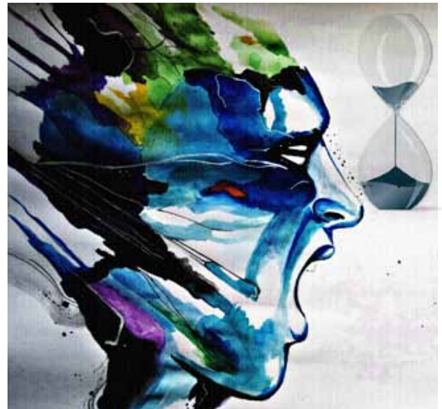
Pues el tiempo de los rebeldes se agota, ilustración

En Jerusem se organizó un consejo de emergencia de ex-mortales compuesto de Mensajeros Poderosos, mortales glorificados que habían tenido una experiencia personal en situaciones semejantes, junto con sus