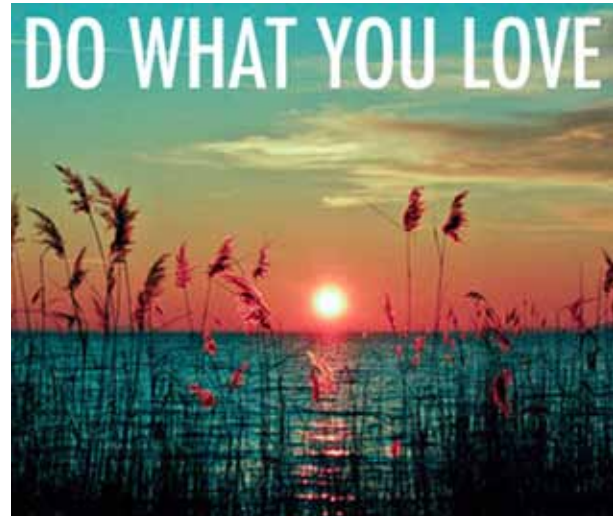
Haz lo que amas; foto

Si bien entiendo estos sentimientos, realmente no estoy de acuerdo. Desde nuestra perspectiva, podría parecer que el progreso es lento; pero el intervalo de tiempo de la revelación de época se mide en milenios y no en décadas. Nuestra vida es relativamente corta y necesitamos recordarnos a nosotros mismos el ámbito de la revelación y que quizá no veamos progresos en nuestra vida. A Jesús le gustaba señalar que “todo día tiene su afán”, y él mismo personificaba esa actitud: esperó durante años a comenzar su ministerio público hasta que llegó el momento.