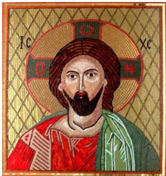
Byzantine mosaic icon of Jesus

Hijo no había convivido siempre con el Padre sino que había sido creado; nosotros, que seguimos a un Hijo Creador que no es idéntico a Dios, haríamos bien en recordar que esta polémica sobre una jerarquía de las Deidades mucho más simple causó enormes daños a la unidad de la iglesia cristiana.