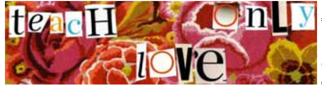
Enseña amor, collage.

En primer lugar, cuando el tutor de aquel curso de desarrollo personal hizo esa pregunta: ¿qué es lo que creen