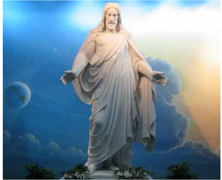
Escultura de Jesús, foto.

[Documento 120:3.7, página 1330:2.3] Debido a que no dejó legado escrito, correspondía a sus seguidores escribir e interpretar necesariamente sus enseñanzas. Cada uno de los cuatro evangelios que forman el núcleo del Nuevo Testamento cuenta la misma historia, pero hace hincapié en un aspecto diferente de la vida del Maestro y de sus enseñanzas. La diferencia principal entre la cuarta revelación de época y la quinta es que esta última está escrita. Por escrito, pero a menudo difícil de interpretar para nosotros los mortales. La cuarta también se cristalizó en forma escrita con el tiempo, por supuesto, pero después de los hechos y escrita por mortales para mortales en un lenguaje que entienden