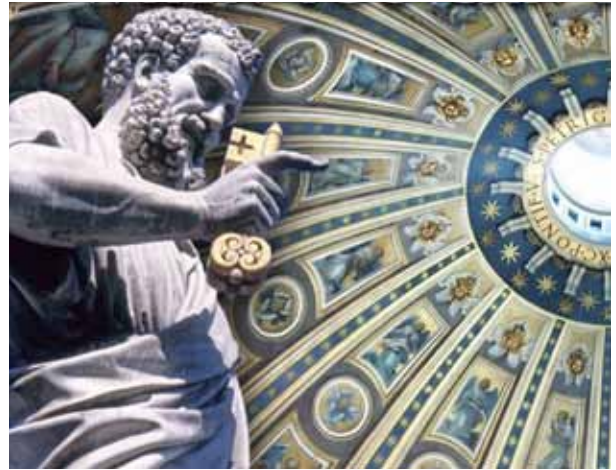
Enseñar la Verdad – sostener la llave del conocimiento.

Jesús tenía una perspectiva completa del universo, y este hecho es el que distingue a Jesús del resto de líderes religiosos que le precedieron, y desde su otorgamiento en la tierra. Jesús conocía y amaba al Padre Universal. Conocía la personalidad del Padre y, aunque no podía explicársela a la gente de su tiempo, podía revelar los atributos de su Padre en todo lo que decía y hacía. Jesús conocía la diferencia entre alma y espíritu; conocía los cielos y la vasta jerarquía celestial;