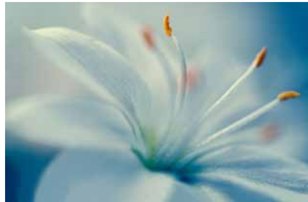
Pétalos desplegados, foto

Al crecer en Irlanda, la violencia en el norte inundaba nuestras noticias nocturnas por televisión. Inmersa en imágenes de conflicto religioso, cuestionaba cómo podrían coexistir algún día religiones diferentes.