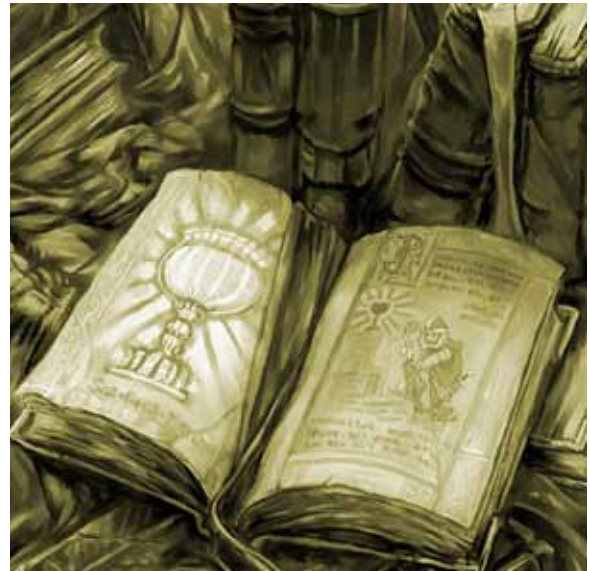
Búsqueda del Grial, ilustración

Entonces, ¿qué es la perfección y cómo definirla? El libro de Urantia habla de 3 tipos y de 7 fases de manifestación de la