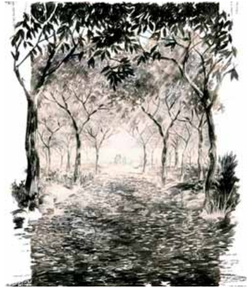
Camino a la perfección, ilustración

William Sadler Jr., en su “Estudio del universo maestro”, describe Havona en la segunda era universal como la tesis divina de la perfección – el desafío de Dios a la imperfección de los universos evolutivos que la rodean –. Nuestra era actual es la antítesis de la