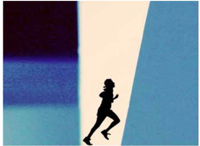
Segunda legua, ilustración

En la mañana del 7 de abril del año 30 a.C., hace unos 2000 años, mientras Jesús estaba ante Pilatos, hizo justamente eso: nos elevó a todos a ojos de su universo. Demostró que, incluso en un planeta atrasado, el hombre podía vencer todas sus vicisitudes. Validó para toda la eternidad el plan de ascensión del Padre. Mostró de una vez por todas que todos los hijos por la fe de los reinos son imperturbables. Su vida dio ejemplo de que todas las posibilidades trascendentes de la humanidad son alcanzables cuando el hombre entra en asociación con Dios. Unos 2000 años más tarde, El libro de Urantia es nuestra llamada para despertar a esa asociación. Y la iluminación de Jesús del máximo potencial humano nos llama a nuestra tarea.