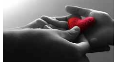
Dar amor, ilustración

L A VERDAD, LA BELLEZA Y LA BONDAD SON amor en movimiento. La comisión de intermedios dijo de Jesús: