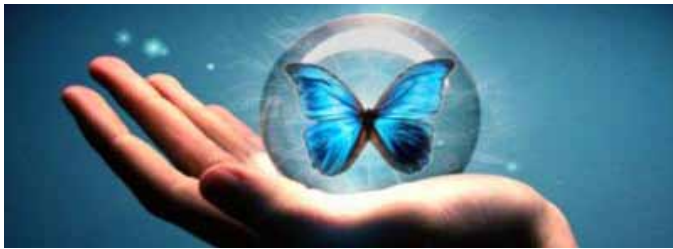
El espíritu de dar, ilustración