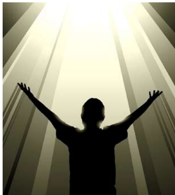
Recibiendo Luz. Ilustración.