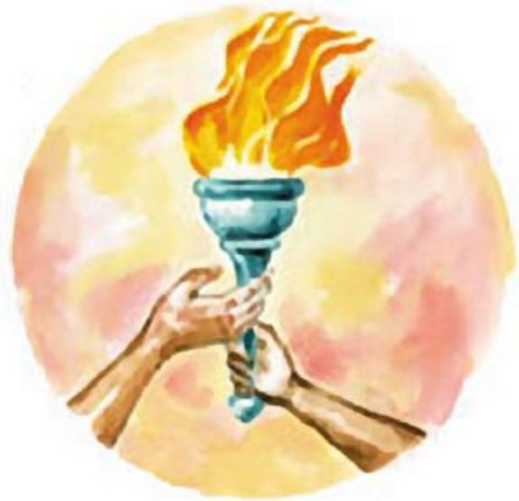
Pasando la antorcha. Ilustración.

La urgencia es obvia. Sólo tenemos que mirar a nuestro alrededor para saber que el mundo está cambiando. Hay cambios de paradigma en todas las instituciones: políticas, sociales, financieras y religiosas. Estos cambios suceden a una velocidad cada vez mayor. Tenemos que hacer surgir nuevos líderes que nos sigan