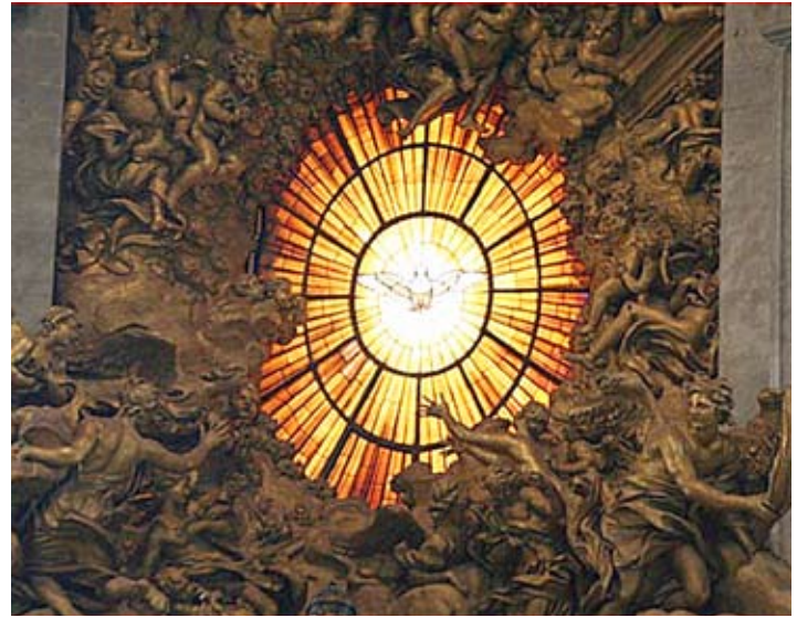
El encuentro de los fieles, detalle de la ventana.

Dios les ha traído aquí esta semana por una razón. Es importante para ustedes estar aquí porque lo que estamos haciendo es importante; creo que esta revelación es el proyecto más importante de este planeta hoy día. Aunque nos importa que nuestros hermanos y hermanas tengan comida suficiente, buena atención médica y una educación adecuada, nos preocupan sus almas eternas. Dios nos ha dado esta oportunidad y esta responsabilidad. Han tomado la decisión de ser líderes de la quinta revelación de época. Ha habido grandes líderes espirituales de Urantia en el pasado. Hay grandes líderes con nosotros