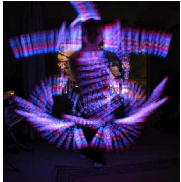
Movido por el espíritu. Imagen.

El desarrollo espiritual depende, en primer lugar, del mantenimiento de una conexión espiritual viviente con las verdaderas fuerzas espirituales y, en segundo lugar, de la producción continua de los frutos espirituales,