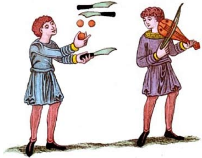
Dominio de una habilidad. Ilustración.

Hoy tenemos unos siete mil millones de personas en el mundo, y la mayoría son seguidores de un líder religioso o de otro, y todos siguen las prácticas espirituales que estos líderes recomiendan. La cuestión que sigue vigente para mí es por qué no hemos progresado espiritualmente de manera colectiva. Sí, hemos progresado algo; a lo largo de mi vida he visto un interés en aumento por la espiritualidad, y una preocupación cada vez mayor por el bienestar del planeta, pero nuestros esfuerzos no han tenido el poder espiritual de reformar de verdad a las personas. En nuestra sociedad, la unidad familiar (la gloria que corona toda la larga y ardua lucha evolutiva) se está desintegrando. Este año ha sido el primero desde que hay estadísticas en el que las familias con los padres originales que viven con sus hijos están en minoría. Vivimos en una sociedad donde niños matan a otros niños porque no tienen modelos que seguir, y donde nuestros líderes carecen de integridad e incluso en algunos países se muestran violentos hacia su propio pueblo. Vivimos en