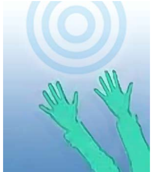
Recibiendo una revelación. Ilustración.

Resultó que la mujer era una capaz secretaria y gestora que trabajaba en el Federal Reserve Bank de Chicago. Su ocupación era enviar a cientos de inspectores bancarios por todo el Medio Oeste. Una