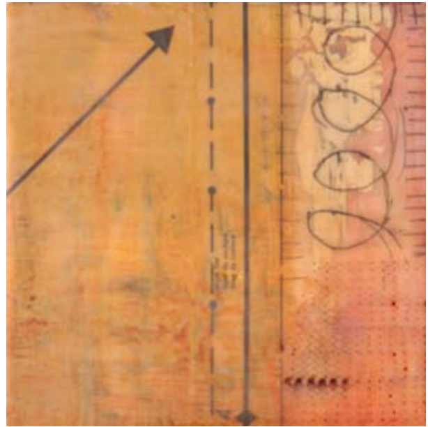
Hacia adelante y hacia arriba. Ilustración.

El éxito del estado mayor del Príncipe procedía de la coordinación de su perspicacia en patrones universales más altos, junto con su conocimiento de los hechos del mundo en el que estaban sirviendo. Hay dos niveles de entrada para