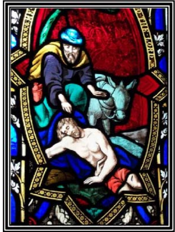
Vidriera de la iglesia de Santiago Apóstol — foto: Marc Belleau

¿Cuál es la función del servicio en el plan educativo del universo? Además de ser la expresión del amor que nos lleva a