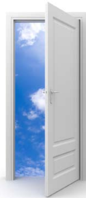
Ilustración de la puerta hacia el servicio