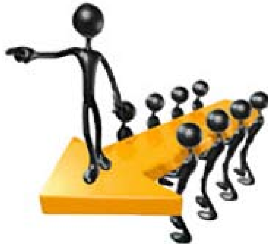
Ilustración de liderazgo

Los buenos líderes esperan resultados. ¿Para qué sirve alguien sin habilidades ni destreza ocupando un lugar en una organización o en un equipo? Un líder mantiene a la gente activa. Eso no significa que haya que ser un dictador o exigente en extremo. Creo que significa