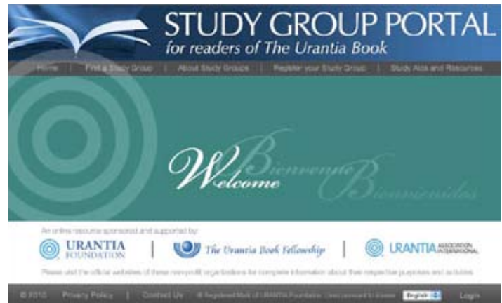
Página de inicio del portal de grupos de estudio

El Portal de Grupos de Estudio fue construido para fomentar la creación y desarrollo de grupos de estudio. Pero, como recurso de Internet, el portal es algo nuevo, un listado voluntario siempre accesible para que los anfitriones lo actualicen, y un servicio de contactos siempre disponible para los lectores que busquen un grupo de estudio. A medida que los anfitriones se registren y la base de datos crezca, los que quieran estudiar en un entorno de grupo podrán buscar un grupo allá donde vivan o viajen. Con una interfaz y protocolo de usuario similar a las redes sociales, es fácil navegar por el portal.