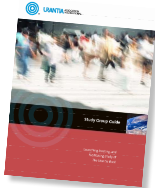
La Guía de Grupos de Estudio de la AUI

No hay requisitos para formar un grupo de estudio, más que el deseo de las personas de compartir un tiempo de calidad con otros buscadores de la verdad.