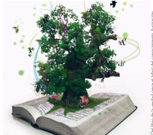
Del libro de la verdad crece el árbol del conocimiento, ilustración

Q UIERO SER ÚTIL CUANDO ENSEÑO sobre este libro o (lo que es más importante) útil a los sus semejantes en el servicio a Dios. Y este libro es sólo una parte de ello, para nada el todo.