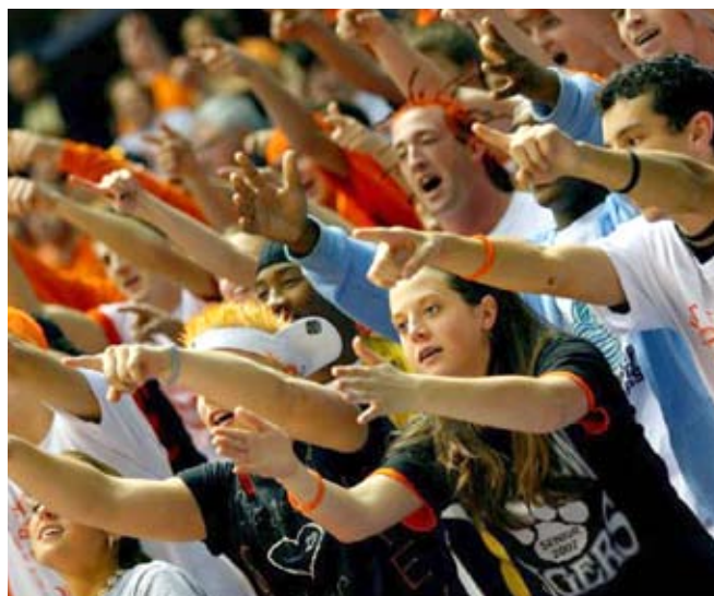
Animando al equipo, foto

Esta misión es de Miguel; tenemos el humilde privilegio de ser sus jugadores. Como se afirma en los Estatutos de la AUI, todos nuestros esfuerzos se dirigen a fomentar el estudio de El libro de Urantia y a diseminar sus enseñanzas. Estamos participando en una misión mundial en crecimiento para fomentar el estudio y que todos se beneficien. Al final el plan de Miguel triunfará (en opinión de quien escribe), para transformar a los mortales desde la naturaleza humana hacia la naturaleza divina . No vamos a interpretar las enseñanzas, sino solo a diseminarlas, a dejar que encuentren suelo fértil en el alma de cada mortal. Vamos a permanecer leales al equipo