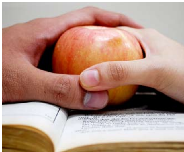
Traspaso de conocimiento, imagen

¿Qué clase de aprendizaje espera ofrecer, y qué tipo de enseñanza sería el adecuado?