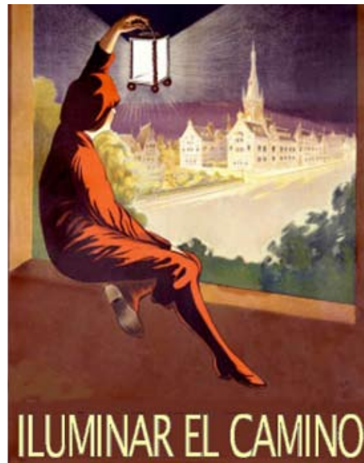
No puedes iluminar el camino de otro sin que brille el tuyo. ilustración

Hay suficientes semejanzas en las definiciones como para concluir que el liderazgo es un esfuerzo por influir en otros y la capacidad de provocar el acuerdo. Nuestro