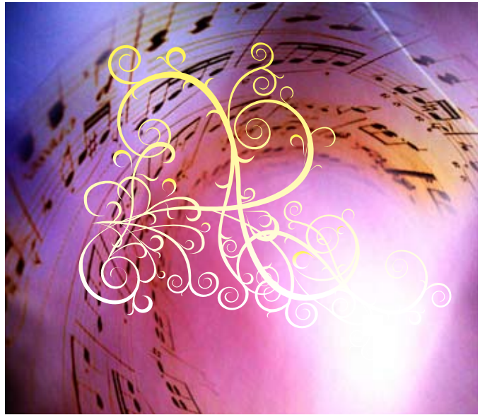
Suave resplandor sobre flujo musical - imagen

La perfección de la belleza en la eternidad, en todos sus aspectos espirituales, es el logro definitivo para peregrinos del Paraíso como usted, que comienzan en un mundo físico que