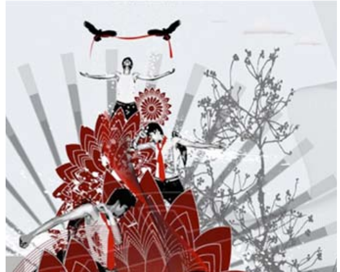
Ilustración: Crecimiento Personal.

...no he dudado nunca de que estuviéramos dialogando, de que fuera el dialogo entre dos seres conscientes, uno de los cuales es sordo. Puedo hablar, pero no puedo oír. Y no dejo que mi sordera afecte a mi fe en lo más mínimo. Pido siempre ayuda a mi socio sobre determinadas cosas: ¿De qué otra forma puedo ser de utilidad? ¿Hay acaso algo mejor que hacer frente a mi ego, ese ser beligerante que no estoy seguro de haber conquistado?