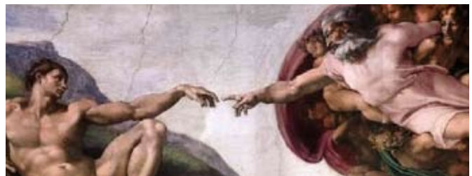
Pintura de Miguel Ángel.

... El hombre que encuentra a Dios y Dios que encuentra al hombre — la criatura que se vuelve perfecta como lo es el Creador — ésta es la realización celestial de lo supremamente hermoso, esto es alcanzar la cúspide del arte cósmico. [Documento 56:10, página 646:4]