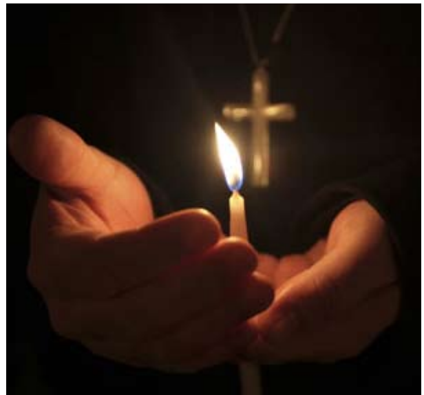
Foto: Jesús nos guiará en las tempestades de la vida.

Los dos hombres del astillero se convirtieron en miembros destacados de la iglesia fundada por Felipe, e influyeron a un centurión romano para que se hiciera creyente del ministerio de Pedro. Uno de ellos murió ministrando a 20.000 judíos mientras estaban siendo masacrados. [1430:3]