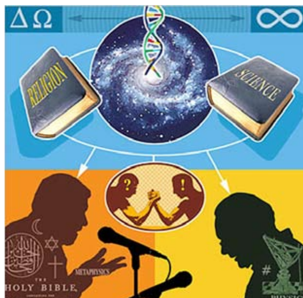
La experiencia de la comunicación ilustración

Lo que une y constituye un rasgo común de las religiones y teologías evolutivas, basadas en la razón humana, es su concepto falso de Dios. El dios teológico de las religiones monoteístas es contradictorio y desunido, un Dios profundamente pequeño, minuciosamente doméstico y a menudo cruel, un legislador castigador que adjudica la condenación eterna a todo el que viola sus leyes y normas. Ni una sola de las religiones institucionalizadas existentes comprende la grandeza de Dios (aun cuando puedan llamarle el Todopoderoso) – su carácter de totalidad, de multifacético y multipersonal –. El Dios de las religiones es simplemente dios, aunque