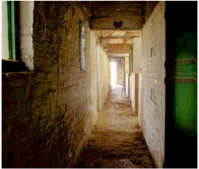
Jesús siempre estaba preparado para mostrar el camino. Foto

EL JOVEN QUE TENÍA MIEDO [1437] — Todos tenemos lo que llamamos partes favoritas de El libro de Urantia y, para mí, esta es una de ellas. He aquí la historia