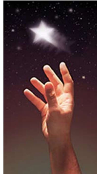
Busca lo más elevado y ahí descubrirás todo lo demás. Ilustración.

Si usted vive la verdad, vive de verdad. Si intenta encerrar la verdad, el estancamiento llegará rápidamente. La Verdad del Padre se mueve, es flexible, vive, en tanto que el dogma es estático, inflexible y muerto. Usted