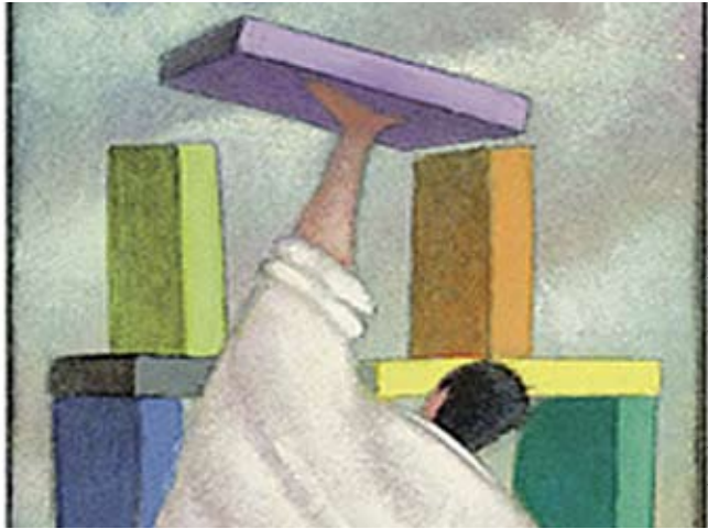
entendiendo puentes, colocando bloques, ilustración

talentos diferentes a los que sólo les ponen límite nuestra imaginación y nuestra voluntad de servir