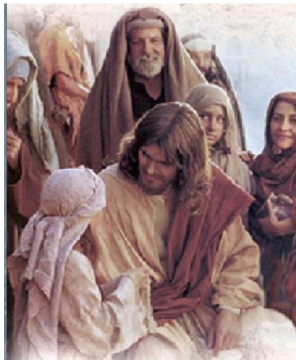
Jesús amaba a todas las personas, en especial a los niños. . . ilustración

E STA SESIÓN CUBRIRÁ LOS PRIMEROS años de Jesús, así como su ministerio personal, comenzando con su aparición en el templo de Jerusalén a la edad de 12 años, a través de los tiempos de prueba tras la muerte de su padre, cuando tuvo que asumir responsabilidades de adulto siendo apenas un chico. Y concluye describiendo su viaje de dos años a Roma y el logro final de la soberanía completa de un universo.