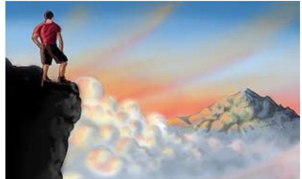
Buscador en la cima de la montaña ilustración

La verdad es que usted no abandonó nada para obtener su vida individual (excepto quizá la no existencia en la eternidad) y no hay nada que le mantenga en