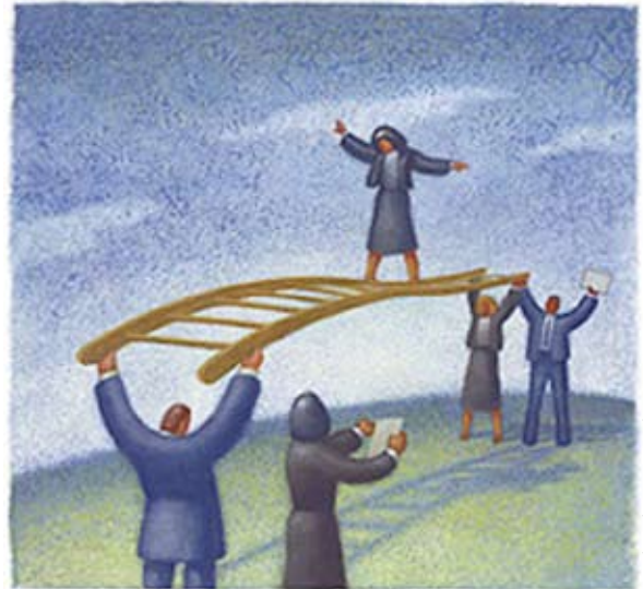
Tendiendo puentes. Ilustración.

«El gran desafío del hombre moderno es conseguir una comunicación mejor con el Monitor divino que mora dentro del alma humana. La mayor aventura del hombre en la carne consiste en el esfuerzo bien equilibrado y sensato por hacer avanzar las fronteras de la autociencia para atravesar hasta más allá de los reinos