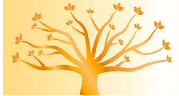
La verdad echa brotes ilustración

Vaya un enorme lapso de verdad que ofrece la revelación, desde el despertar del alma en su planeta completamente autocontenido, orgánico y en movimiento llamado Urantia, hasta las orillas de la Verdad Absoluta y la presencia del Padre en el Paraíso. Ahí fuera, en los mismos bordes de la imperfección, usted ha nacido en abyecta ignorancia, sin ni siquiera conocer el concepto de verdad. A medida que crece en cuerpo, mente y espíritu, los aspectos de la verdad, la belleza y la bondad van formando parte de su ser, una experiencia a cada vez.