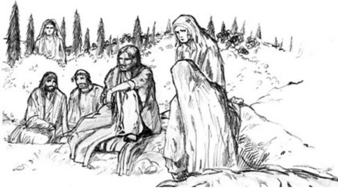
En sus viajes, Jesús conoció a toda clase de gente. Ilustración

Al molinero le enseñó acerca de moler los granos de la verdad en el molino de la experiencia viviente, para hacer comprensibles las cosas difíciles de la vida divina a nuestros compañeros mortales débiles y endeblés. Dijo Jesús: Da la leche de la verdad a aquellos que están en la infancia de la percepción espiritual [1474:2] Aquellos de nosotros que pueden comprender algunos de los conceptos más difíciles de El libro de Urantia, deberíamos encontrar maneras de explicarlos con términos sencillos a aquellos que están simplemente aprendiendo. No damos cereales a un bebé hasta que tiene hambre de algo más que de leche.