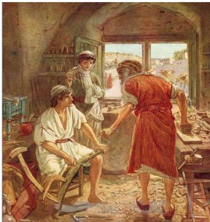
Joven Jesús aprendiendo las habilidades de la carpintería. ilustración

Desde ese día, Jesús y el mundo -incluso el universo- nunca serían igual. El libro de Urantia nos dice que fue en ese momento de la vida de Jesús que una oleada de iluminación espiritual atravesó la mente mortal de Jesús e inundó su corazón humano de piedad afectuosa por las multitudes espiritualmente ciegas y moralmente igno-