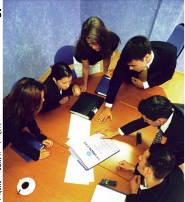
"Grupo de estudio del LU" Composición

...en general somos sumamente conscientes, por nuestra propia naturaleza buscadora de la verdad, de cómo discernir la verdad, y podemos decidir por nosotros mismos lo que debemos tomar para progresar espiritualmente en nuestra vida personal..