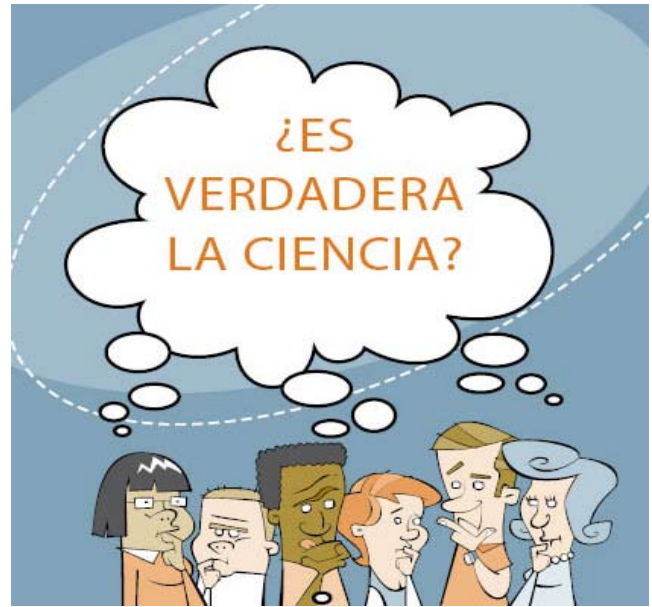
“¿Es verdadera la ciencia?” Ilustración

Pero aunque desechó creencias caducas e insostenibles, difundió la idea de que los humanos existen al filo de algo maravilloso; que podemos (y somos libres para) vislumbrar algo numinoso insinuado por la verdad; sentir lo que se manifiesta en la belleza y el poder del cosmos. Dejó en el aire las preguntas de si, y por lo que significa, podríamos interactuar con “lo numinoso”, este fundamento indefinible y fuente de realidad. Permitió que los escépticos fueran libres para reflexionar, sin la presión de tener que discutir o estar de acuerdo.