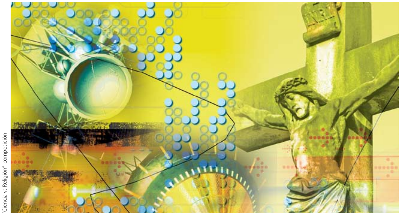
"Ciencia vs Religión" composición

Como lectores de los documentos de Urantia, podemos ver que esos autores y personajes parecen preparados para implicarse en un marco de pensamiento inimaginable hasta ahora por la humanidad. Pero muchos de esos mortales modernos han aprendido a buscar pruebas antes que a aplicar lo que creen que es una fe medieval desacreditada. ¿Cómo podrían esas almas aceptar siquiera "una revelación" como la de los documentos de Urantia? Del mismo modo, ¿es realista esperar que cualquiera de las grandes tradiciones religiosas pueda pasar por el ojo de la aguja hacia un marco ampliado de quinta época? Tanto en uno como en otro ámbito sería probablemente un salto demasiado grande.