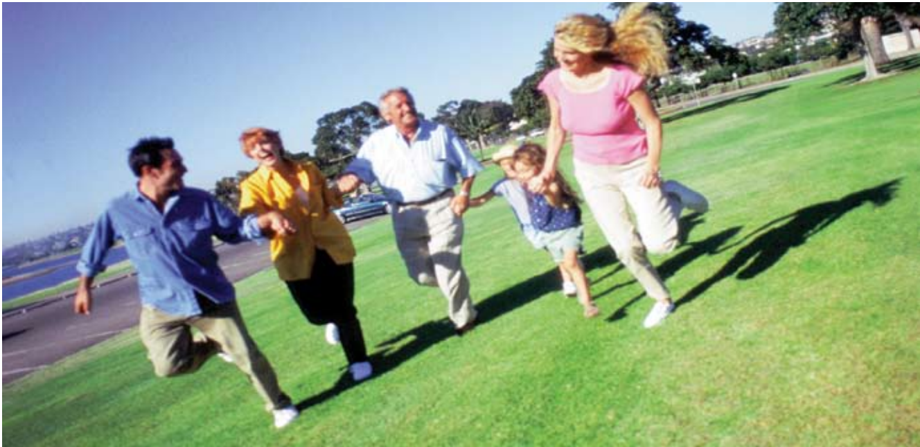
"Familia Dinámica" Foto