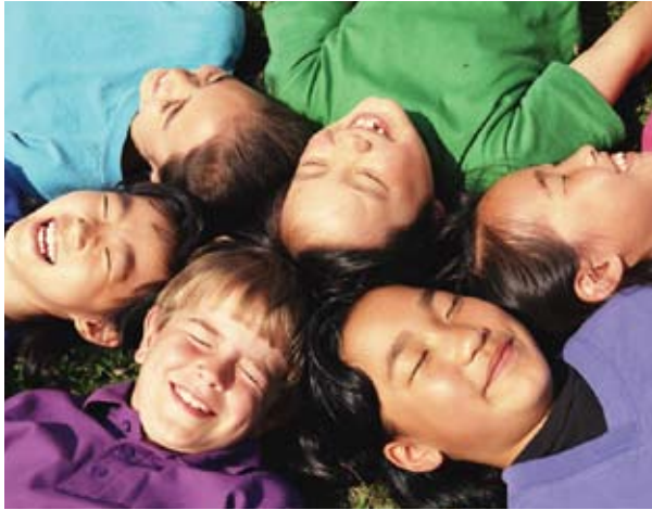
"Amor entre las personas" Foto