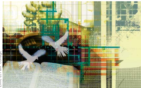
"Livre et Paix" collage

Il est vrai que certaines des activités nécessaires au développement du projet UBtheNEWS sont plus adaptées à ceux d'entre nous qui ont une bonne éducation, du talent