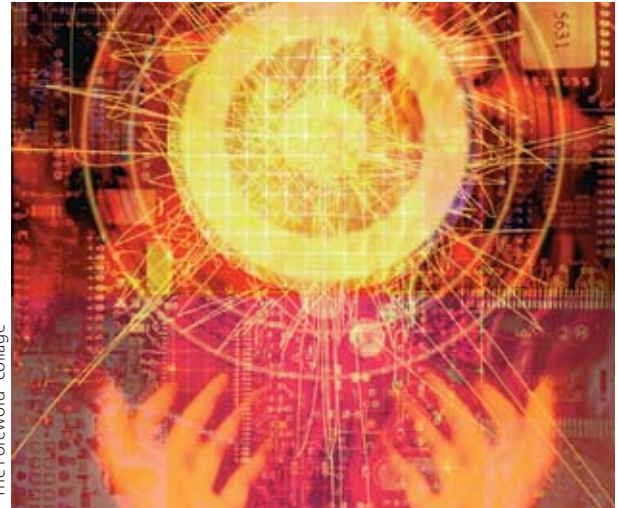
“The Foreword” collage

Sin que fuera una sorpresa, tuvimos una reacción natural a estas experiencias. Nos sentimos heridos y desilusionados.