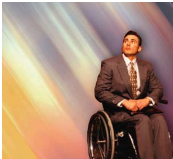
« guérison » collage

L'homme qui connaît Dieu décrit ses expériences spirituelles non pas pour convaincre les incroyants, mais pour édifier et satisfaire mutuellement les croyants [30:5]