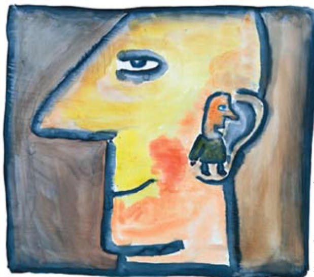
« Voix intérieure » artisanale

Nous sommes si importants que le Dieu du Paradis, le soutien de toutes choses, a créé des gouvernements d'univers, des systèmes judiciaires, des enseignants pour nous enseigner, des séraphins pour nous guider et un gigantesque nombre d'êtres pour nous venir en aide dans notre voyage à destination du grandiose but que Dieu nous réserve, quel que soit ce but. J'aime dire aux gens que Dieu a un plan pour notre vie... Mais ce n'est pas cela. Je travaille dans une aciérie. Est-ce là ce que Dieu veut pour ma vie? Non. Dieu a en réserve quelque chose de beaucoup plus important et de beaucoup plus grandiose pour vous et moi qui nous attend quelque part dans l'éternité.