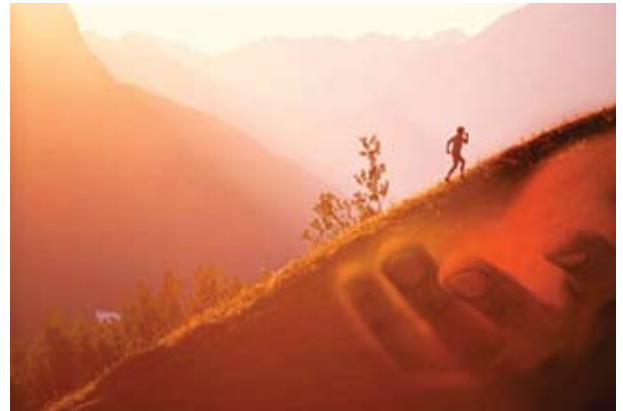
« Inspiration » collage

Un autre jour ensoleillé, quelques mois plus tard, je me trouvais exactement au même lieu, au bout du dock, à contempler les eaux bleues, étincelantes, du détroit de Harrington, à me souvenir de nouveau de ces jours heureux en bateau et d'avoir été "sauvé" près de l'île de Cockroach. Le soleil brillait, il faisait beau et j'étais en pleine forme. La visite précédente était complètement oubliée, la dépression morbide, tout comme l'affaire que j'avais eu l'effronterie de vouloir faire avec Dieu. Aujourd'hui, j'étais heureux de rester assis et de me mettre "à niveau" comme le dit José Sylva de sa technique