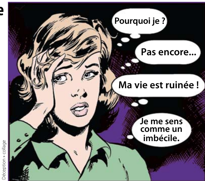
« Déception » collage

Ce qui suit provient d'un atelier de travail présenté par Benet lors du congrès international 2006 de l'AUI, organisé par Anzura à Sydney, Australie.