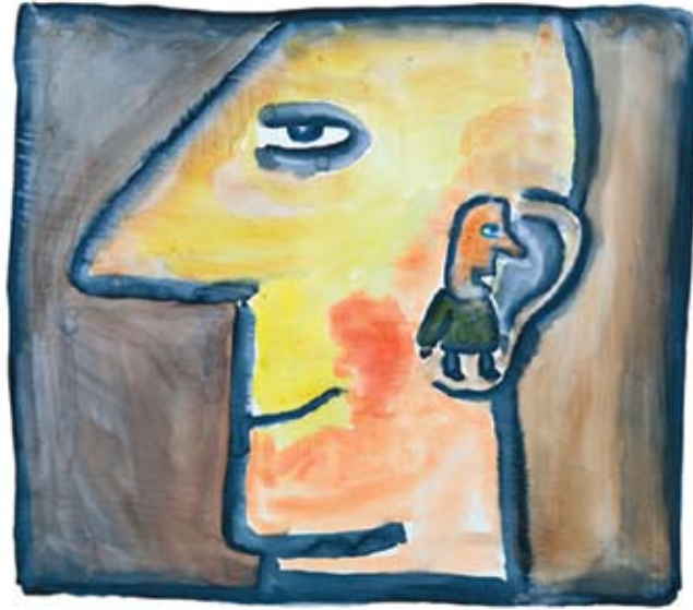
“Voz interior”, ilustración

Somos tan importantes que el Dios del Paraíso, el sostenedor de todo, creó los gobiernos del universo, los sistemas judiciales, los maestros para enseñarnos. Los serafines nos guían, y enormes cantidades de seres apoyan nuestro viaje hacia el gran propósito que Dios nos tiene preparado. Me gusta decir a la gente: “Dios tiene un plan para tu vida... ¡pero no este!” Trabajo en una fundición. ¿Es ese el propósito de Dios para mi vida? No. Dios