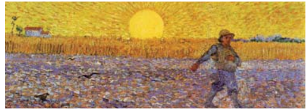
"Semeur avec coucher de soleil" Vincent Van Gogh, 1888

Plusieurs traductions n'ont guère commencé à être semées, sauf la française, l'espagnole et la finnoise. (N.B. Les Finlandais s'occupent à faire des traductions pour leurs voisins, et ensemencent les nations adjacentes.) Les traductions lituanienne et russe sont publiées et