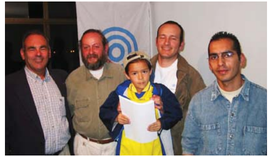
L'auteur (à gauche) et des lecteurs de Bogota, Colombie

Les chefs des groupes d'étude intéressés à cette méthode devraient faire très attention quand de nouveaux lecteurs sont présents. Il est plus sage et approprié si chaque participant a précédemment lu Le Livre d'Urantia entièrement et est arrivé à un désir sincère d'acquiescer une compréhension plus profonde. Cette méthode ne se fonde pas seulement sur l'intelligence ou l'acuité intellectuelle. D'autres méthodes pourraient être plus appropriées pour de nouveaux lecteurs où le facilitant serait habile et bien informé dans différentes méthodes d'animer des groupes d'étude.