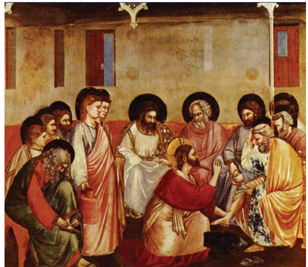
«Jésus lave les pieds des apôtres» Giotto, 1303-1305

Le vrai maître maintient son intégrité intellectuelle en restant toujours un élève. [1433:2]