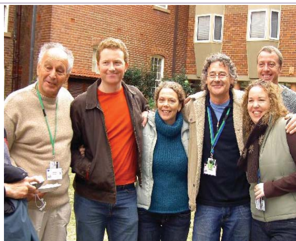
Au centre, l'auteur avec famille et amis.