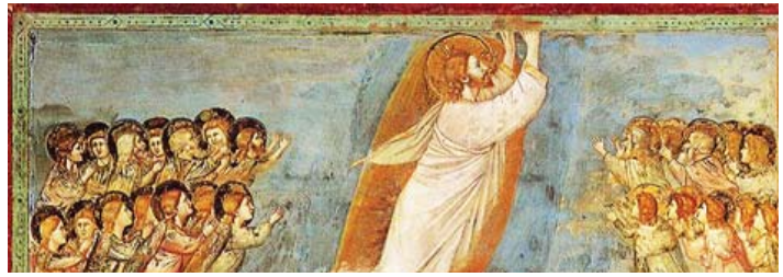
"Ascension" détail, Giotto, 1304-1306