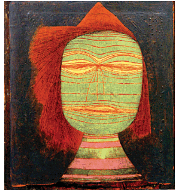
"Masque d'acteur" Paul Klee, 1934

Vous avez appris à d'autres bien des choses au cours de votre vie, mais il se pourrait que vous n'avez pas été conscients qu'il s'agissait là d'enseignement.