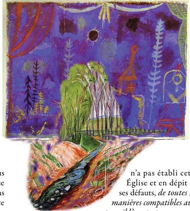
“Ruisseau isolé” collage de Paul Klee et Edward Munch

Au-dessous des petits ruisseaux, plus bas, court le “fleuve de vérité” chrétien, l'interface traditionnelle du Christ qui élève les mortels nés d'esprit qui se dévouent pour continuer son œuvre sur Terre. Même si Jésus