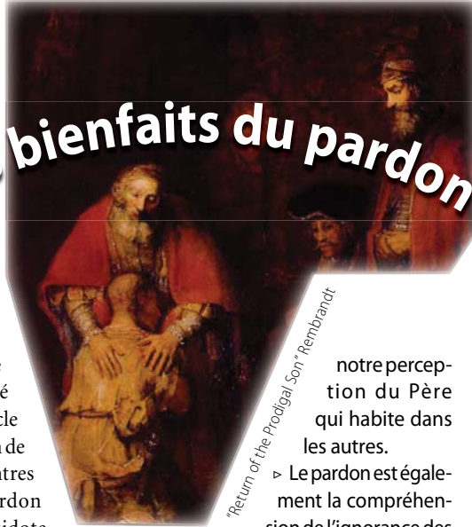
“Return of the Prodigal Son” Rembrandt