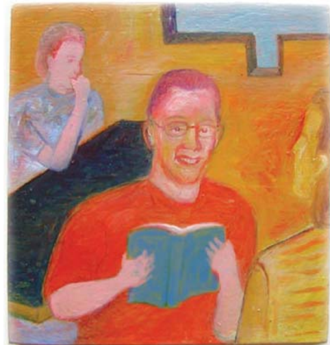
"Blue book" MC

NOTE: La partie 1 de cet article a été imprimée dans l'édition octobre 2005 du Journal UAI, pages 8-11. Dans cette section de l'article se poursuit la discussion de "Principes de méthode", qui incluait: (1) Être patient, (2) Distinguer les buts des méthodes, (3) N'offrir des enseignements avancés qu'à ceux qui connaissent déjà Dieu, (4) Une interaction vivante précède normalement la présentation de l'ensemble de la révélation. La partie 2 de cet article commence avec (5).