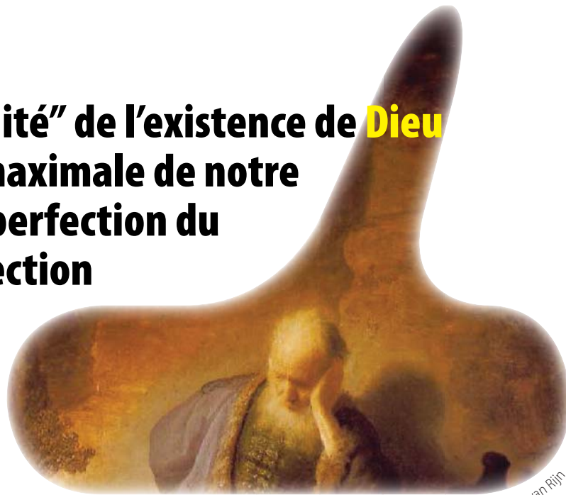
Détails d’une peinture de Rembrandt van Rijn

SANTIAGO RODRÍGUEZ Urantia Association d’Espagne