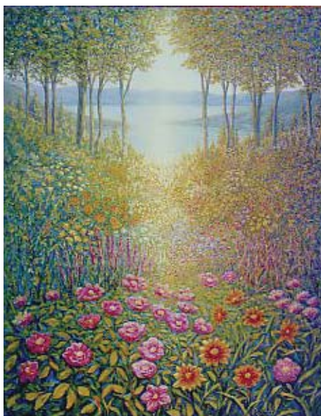
“Pequeña Utopía” Pintura de Carlos Rubinsky

Esta es la definición que leo cuando busco en mi diccionario inglés la palabra “insight”: “el poder de usar la propia mente para entender