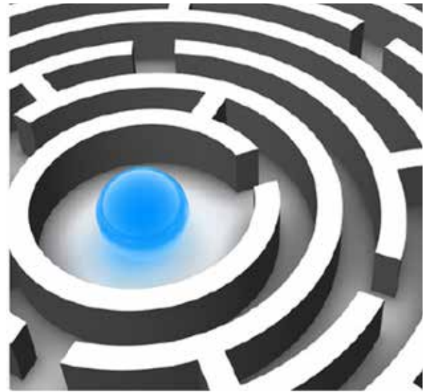
Chemins dans la quête pour trouver le Père, illustration

Donc, nous voici, 10.000 personnes religieuses de plus de 80 pays et 50 voies spirituelles différentes réunis pour cet événement extraordinaire, le sixième Parlement des Religions du Monde, tenu à Salt Lake City, Utah pendant cinq jours, du 15 au 19 octobre 2015. Le premier Parlement qui est maintenant reconnu comme la naissance du dialogue interreligieux à travers le monde a eu lieu en 1893 à Chicago; il a été conçu par le juge Charles C. Bonney. 100 ans plus tard, plus de 8000 personnes sont venues à Chicago pour la deuxième tenue de cet événement en 1993. En 1999, le Parlement a réuni à nouveau les gens de