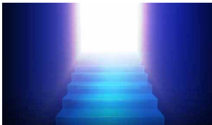
La porte est ouverte, illustration

Pour Jésus, Judas était une aventure de la foi. Dès le commencement, le Maître avait parfaitement compris la faiblesse de cet apôtre et connaissait bien les dangers de l'admettre dans la communauté. Mais il est dans la nature des Fils de Dieu de donner à tout être créé une chance entière et égale de salut et de survie. Jésus voulait que non seulement les mortels de ce monde, mais aussi les observateurs sur