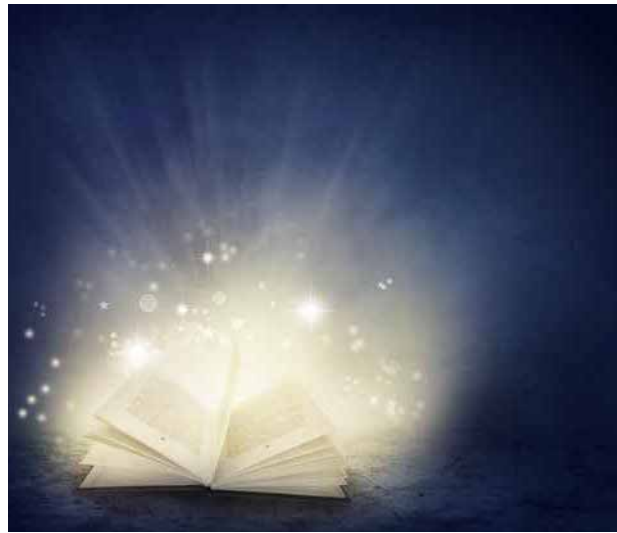
Le Livre d'Urantia est la troisième présentation de la Trinité à l'humanité