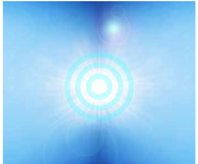
Trinité du Paradis image

Le défi affectueux que m'avait lancé mon ami me rappelait que même les Hébreux de l'ancien testament furent autrefois polythéistes et qu'étant passés par les luttes de l'hénothéisme ils devinrent des zélotes monothéistes un peu comme les Bédouins de la péninsule arabique. Le temps passant, le peuple hébreu s'en fut à chaque