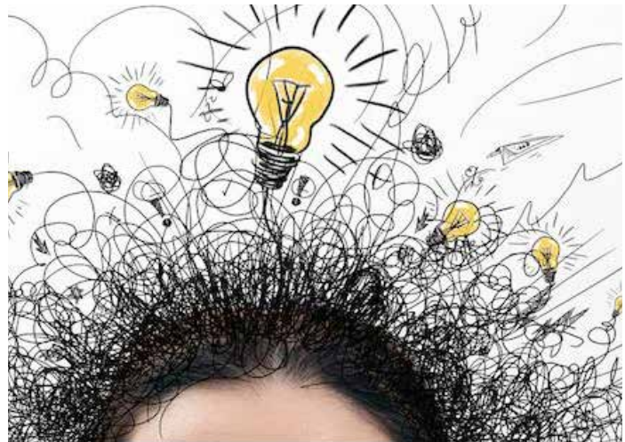
Plein d'idées, illustration.

Quatre ans plus tard j'ai trouvé le Livre d'Urantia .