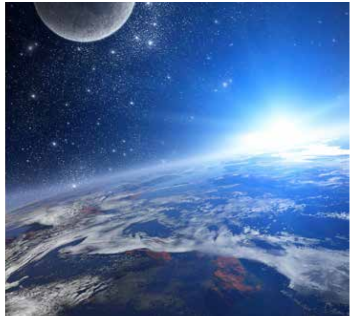
Notre planète bleue, illustration

Neuf mondes sur dix ne sont pas expérimentaux. Sur la dixième, il est permis de s'écarter davantage des modèles de la vie. [Fascicule 36 :2.15, page 398.2]. Cette phrase exigeante concerne neuf mondes sur dix et elle est claire et précise. Mais un problème se pose car, au moins en surface, elle est quelque peu contradictoire avec la phrase suivante « Mais environ un monde sur dix est désigné comme planète décimale et inscrit sur le registre spécial des Porteurs de Vie. » [Fascicule 58 :0.1, page 664.1] Bien que l'expression « environ un monde sur dix » indique qu'il y a quelques variantes mineures qui peuvent temporairement nous